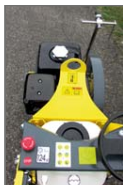
Point de levage central