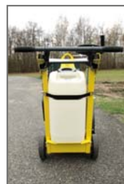
Réservoir d'eau 25 L