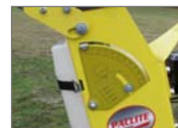
Diamètre lames 450 mm